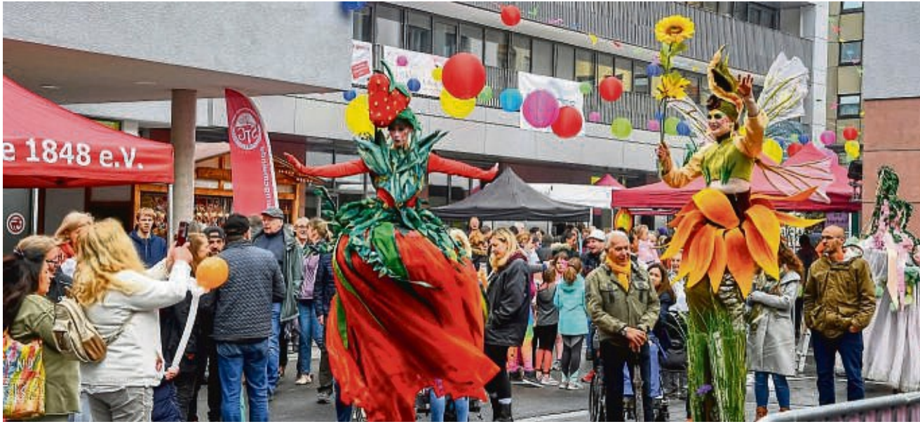
Die Stelzenläuferinnen waren der Hingucker beim Frühlingsfest in der Neuen Mitte. Auf der Bühne präsentierten Vereine, Bands und DJs ein abwechslungsreiches Programm.

Nachdem kürzlich Denn's Biomarkt, Rossmann und die Sparkasse eröffnet hatten, wollen die Besucher nun das Quartier selbst in Augenschein nehmen, von dem sich die Macher erhoffen, die Sprendlinger Mitte zum Leben zu erwecken. Während einige zu viel Beton und zu wenig Grün bemängeln, zeigen sich andere mit der Gestaltung zufrieden. „Es hat anfangs eine Befangenheit